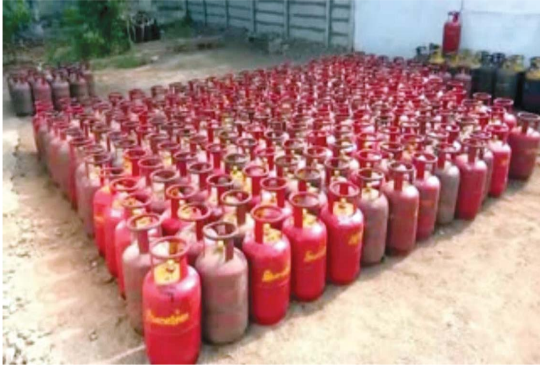
తనిఖీలు నిర్వహించి కేసులు నమోదు చేస్తామని తెలిపారు.

జోగులాంబ జిల్లాలో రాయితీ గ్యాస్ వినియోగిస్తున్న నలుగురిపై క్రిమినల్ కేసులు కట్టారు. పశ్చిమాసియాలో దాడులు తగ్గడంతో పశ్చిమాసియా యుద్ధం కారణంగా గ్యాస్ కొరత ఏర్పడిందనే నేపథ్యంలో వినియోగదారులు పెద్ద సంఖ్యలో బారుబుడిచారు. మార్చి మొదటి వారంలో అధికారులు ప్రత్యేక బృందాలతో దాడులు నిర్వహించి గ్యాస్ సరఫరాలను దుర్వినియోగం చేస్తున్న వారిని పట్టుకున్నారు. ఇటీవల తనిఖీలు సంఖ్య తగ్గినప్పటికీ అక్రమ వ్యాపారం నిరాటంకంగా కొనసాగుతోంది. గృహవసరాల సిలిండర్లను వాణిజ్యానికి వినియోగిస్తే కఠిన చర్యలు తీసుకుంటామని అధికారులు హెచ్చరించారు. నిబంధనలను ఉల్లంఘించినట్లైతే వారిపై