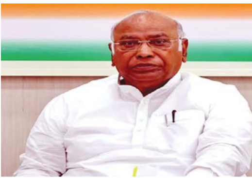
పార్టీవారు. ఈ విధంగా పార్లమెంట్ ప్రత్యేక సమావేశాలకు ముందు కాంగ్రెస్ సీడబ్ల్యూసీ జరగడం ప్రాధాన్యత సంతరించుకుంది.

మహిళా రిజర్వేషన్ల అమలు విషయంలో మోదీ ప్రభుత్వం అనుసరిస్తున్న విధానాన్ని కాంగ్రెస్ అధ్యక్షుడు మన్మోహన్ ఖర్గే శుక్రవారం తీవ్రంగా ఖండించారు. మహిళా రిజర్వేషన్ల పట్ల అమలు చేసేందుకు మోదీ సర్కార్ ప్రతిపాదించిన నియోజక వర్గాల పునర్విభజన (డివిమిటేషన్) ప్రక్రియ తీవ్ర పరిణామాలకు దారితీస్తుందని పేర్కొన్నారు. అంతపై వివక్ష పార్టీలన్నింటితో కలిసి ఒక ఉమ్మడి వ్యూహాన్ని రూపొందిస్తామని, అందరం కలిసి ఐక్యంగా ముందుకు సాగుతామని ఆయన స్పష్టం చేశారు. కేవలం రాజకీయ ప్రయోజనం కోసమే మోదీ ప్రభుత్వం ఏప్రిల్ 7, 16 నుంచి ప్రత్యేక పార్లమెంట్ సమావేశాలు నిర్వహిస్తోందని ఖర్గే ఆరోపించారు. మహిళా రిజర్వేషన్ల సరళణ బిల్లును అత్యంత వేగంగా ఆమోదించేందుకు మోదీ సర్కార్ ఆసక్తి చూపుతోందని, ఇది ఎన్నికల ప్రవర్తనా నియమావళి (ఎంసీసీ)ని పూర్తిగా ఉల్లంఘించడమేనని ఆయన అన్నారు. దిల్లీలో జరిగిన కాంగ్రెస్ వర్కింగ్ కమిటీ (సీడబ్ల్యూసీ) సమావేశంలో మాట్లాడుతూ ఆయన ఈ కీలక వ్యాఖ్యలు చేశారు. అంతేకాదు, ప్రభుత్వం ప్రతిపాదించిన సరళణలు దేశ ఎన్నికల వ్యవస్థపై తీవ్ర ప్రభావం చూసే అవకాశం ఉందని ఆయన ఆందోళన వ్యక్తం చేశారు. కాంగ్రెస్ ప్రధాన కార్యాలయం 'ఇందిరా భవన్'లో మల్లికార్జున్ ఖర్గే అధ్యక్షతన జరిగిన ఈ సమావేశంలో కాంగ్రెస్ అగ్రనేత రాహుల్ గాంధీ, కాంగ్రెస్ ప్రధాన కార్యదర్శులు ప్రియాంక గాంధీ, కేసీ వేణుగోపాల్, జైరాం రమేష్, సచిన్ పైలట్, కర్ణాటక ముఖ్యమంత్రి సిద్ధరామయ్య, తెలంగాణా సీఎం కేవంత్ రెడ్డి తదితరులు