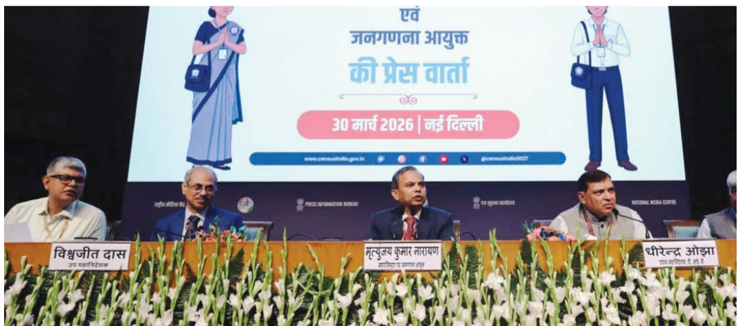
ప్రత్యేక మొబైల్ యూజ్ - ప్రతీ కుటుంబానికి 33 ప్రశ్నలు

స్వీయ గణన - ఐడీ జనరేషన్ - వెరిఫికేషన్ దేశంలో తొలి విడత గృహ గణన ప్రక్రియ ఏప్రిల్ 1 న 5 రాష్ట్రాలు, 3 కేంద్రపాలిత ప్రాంతాల్లో ప్రారంభమైంది. ఈ జాబితాలో గోవా, కర్ణాటక, మిజోరాం, ఒడిశా, సిక్కిం, అండమాన్ నికోబార్ దీవులు, లక్షద్వీప్, దిల్లీ (స్వాధీనీ) మున్సిపల్ కౌన్సిల్ - బీజిపీజ ప్రాంతం, దిల్లీ కంటోన్మెంట్ బోర్డు పరిధి మాత్రమే ఉన్నాయి. ఈ రాష్ట్రాలు, కేంద్రపాలిత ప్రాంతాల్లోని కుటుంబాలు ఏప్రిల్ 1 నుంచి 15 వరకు స్వీయ గణన (సెల్స్ ఎన్యూమరేషన్) సౌకర్యాన్ని వినియోగించుకోవచ్చు. కుటుంబాలకు స్వీయ గణన చేసుకునే అవకాశాన్ని ఇవ్వడం ఇదే తొలిసారి. ఇందుకోసం ప్రత్యేక పోర్టల్ను ( https://se.census.gov.in/ ) రిజిస్ట్రార్ జనరల్ ఆఫ్ ఇండియా అందుబాటులోకి తెచ్చింది. దీనిలో అడిగే ప్రశ్నలకు ప్రజలు స్వయంగా సమాధానాలను సమోద చేయవచ్చు. అన్ని ప్రశ్నలకు సమాధానాలు ఇచ్చాక, ఎన్ఐఐ ఐడీ (Self-Enumeration ID) జనరల్ అవుతుంది. తదుపరిగా ఏప్రిల్ 16 నుంచి మే 15 వరకు జరగనున్న డోర్ టు డోర్ గృహ గణన సందర్భంగా వెరిఫికేషన్ కోసం తమ ఇంటికి వచ్చే ఎన్యూమరేటర్లకు ఎన్ఐఐ ఐడీ ప్రజలు అందిస్తారు.