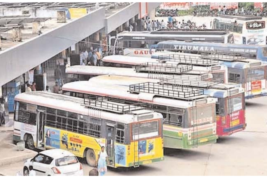
ఉన్న 50.7 శాతం నుండి 52.8 శాతానికి పెరిగింది. తెలంగాణ లో ఉన్న ప్రతి ఆర్టీసీ ఉద్యోగులందరికీ ఇది ఉపయోగపడుతుంది. తెలంగాణ లో లైఫ్ లైన్ గా ఉన్న ఆర్టీసీ

హైదరాబాద్ : తెలంగాణ ఆర్టీసీ కార్మికులకు ప్రభుత్వం గుడ్ న్యూస్ చెప్పింది. ఈ యేడాది 2.1 శాతం డిపి పెంచుతున్నట్లు ప్రకటించింది. మంత్రి పాస్చం ప్రభాకర్ మాట్లాడుతూ డిపి పెంపు సందర్భంగా ఆర్టీసీ ఉద్యోగులకు శుభాకాంక్షలు. ఆర్టీసీ లో పెండింగ్ పనులు అభివృద్ధి కార్యక్రమాలపై పలు రీజయన్ లో ఆర్ ఎం లతో సమావేశాన్ని నిర్వహించి పెండింగ్ పనులు వేగవంతం చేయాలని అధికారులకు సూచించడం జరిగిందని అన్నారు. ఆర్టీసీ ఉద్యోగులకు సంబంధించి ఉన్న ఏకైక పెండింగ్ డిపి ను ప్రభుత్వం విడుదల చేసింది. జనవరి 2026 నుండి 2.1 శాతం పెరిగిన డిపి అమలులోకి వచ్చింది... దీంతో నవంబరున డిపి వల్ల 52.8 శాతానికి చేరింది. జనవరి నుండి ఇప్పటివరకు పెండింగ్ డిపి లు భవిష్యత్ లో వచ్చే మూడు నెలలకు గాను ఒక్కో నెలలో విడుదల చేయడం జరుగుతుంది. తెలంగాణ ప్రజా పాలన ప్రభుత్వం లో మొదటి నుండి ఆర్టీసీ సంస్థ పరిరక్షణ ,ఉద్యోగుల సంక్షేమం, ప్రయాణికుల సౌలభ్యం కేంద్రంగా పని చేస్తుంది. సంస్థకు ప్రధానంగా కార్మికుల సంక్షేమం పై వారికి సంబంధించిన ఆరోగ్య సంరక్షణ కు ఆసుపత్రి ఆప్రెడెషన్ ,కారుణ్య నియామకాలు,ద్వీప కాలంగా రిమాన్ అయిన వారిని త్రిమెన్ కమిటీ ద్వారా తిరిగి ఉద్యోగాల్లోకి తీసుకోవడం ,కొత్త నియామకాలు చేపట్టి పని భారం తగ్గించడం ,కొత్త బస్సులు కొనుగోలు లాంటి అనేక కార్యక్రమాలను చేస్తుందని అన్నారు. పెండింగ్ లో ఉన్న డిపి 2.1 శాతం పెంచడం వల్ల గతంలో