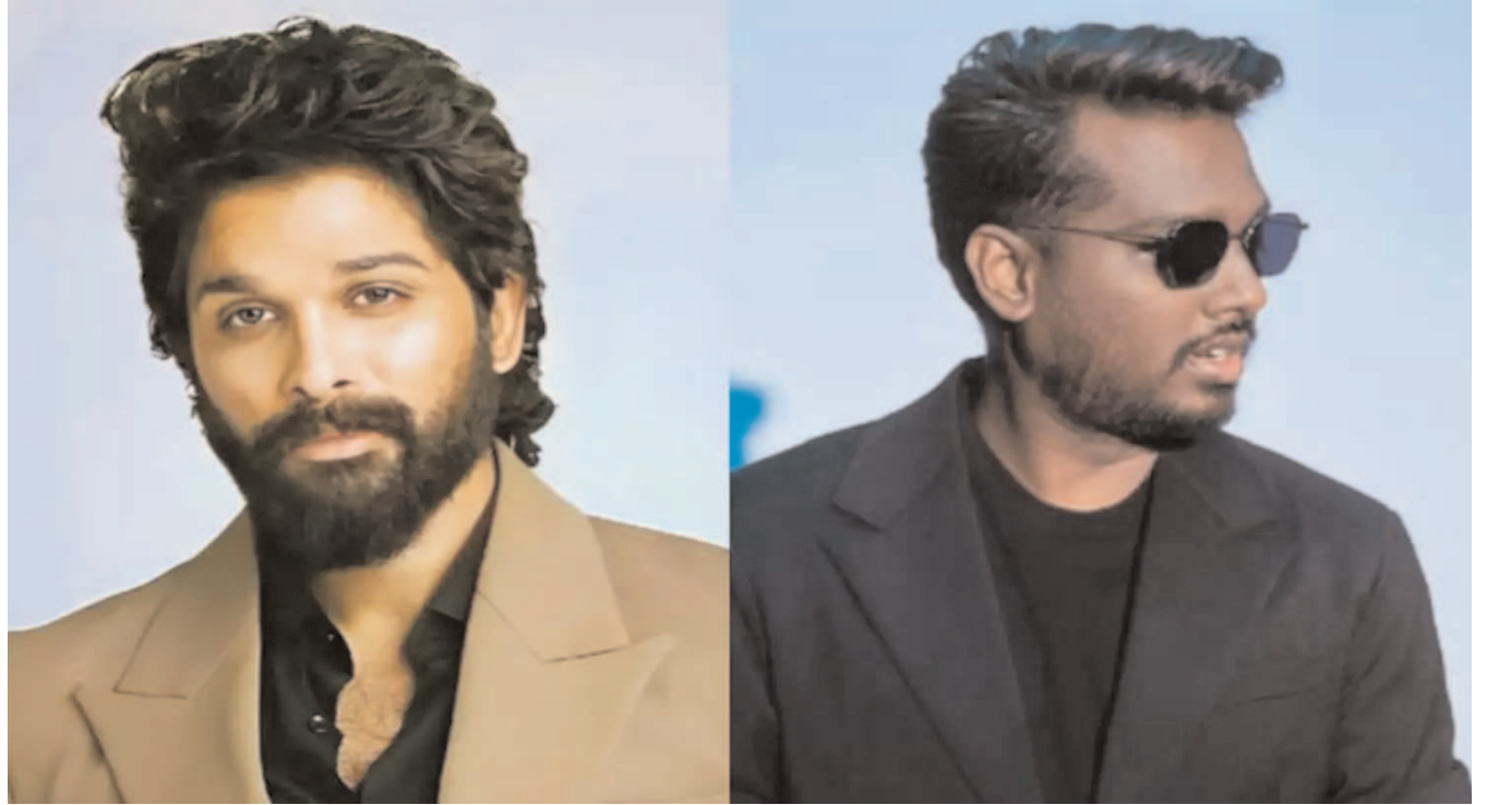
డింతో, ఈ సినిమా తర్వాత ఇంకో మెట్టు పైకి వెళ్లేలా బస్నీ ప్లాన్ చేస్తున్నారు. ఈ లెవెల్లో సినిమాకు హైప్ క్రియేట్ చేయాలంటే, కేవలం స్టోరీ, యాక్షన్ మాత్రమే కాకుండా, అట్లీ ప్రత్యేకమైన మాస్ కమర్షియల్ డ్రీట్వింట్ కూడా ఉండాలి. మరి అట్లీ ప్లానింగ్ ఏ లెవెల్లో ఉంటుందో చూడాలి.

ఇటీవల కాలంలో పాన్ ఇండియా సినిమాల స్ట్రాయి పూర్తిగా మారిపోయింది. ఇక మామూలు మాస్ కమర్షియల్ సినిమాలతో ప్రేక్షకులను ఆకట్టుకోవడం కష్టమవుతోంది. భారీ బడ్జెట్, విభిన్న కథ, ఊహించని మేకింగ్ స్టైల్ తప్పకుండా ఉండాలి. ముఖ్యంగా దర్శకులు ఇప్పుడు కథకు తగ్గట్టుగా కొత్త ప్రపంచాన్ని సృష్టించేందుకు ఎక్కువ సమయం కేటాయిస్తున్నారు. అదే రూల్స్ మరో కాంటినెంట్ కూడా రెడీ అవుతోంది. రాజు సాబ్ 'బాహుబలి' కోసం మహిషాసిని సృష్టించాడని, ప్రశాంత్ సీల్ 'కేజీఎఫ్' లో గోల్డ్ ఫీల్డ్ మాఫియాను చూపించాడని, అదే ట్రెండ్ సలార్, దేవర్ సినిమాల వరకూ కొనసాగింది. ఇప్పుడు ఇదే తరహాలో అల్లు అర్జున్ - అట్లీ సినిమా కూడా రూపొందబోతోందనే టాక్ ఫిల్మ్ నగర్లో వినిపిస్తోంది. ఈ భారీ ప్రాజెక్టును జూన్ లో లాంచ్ చేసి, 2026 ఆగస్టు లో రిలీజ్ చేయాలని మేకర్స్ ప్లాన్ చేస్తున్నారు. అంటే, ఈ