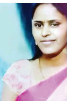
పోలీస్ స్టేషన్ లో పిర్యాదు చేయాలని సిబి కోరారు.

ఇలా అవసరం ఉన్నప్పుడల్లా డబ్బులు డిమాండ్ చేసి అందిన కాడికి దండుకునే పనిలో నిమగ్నమైంది. తాజాగా మరో రెండు లక్షల రూపాయలు ఇవ్వాలని డిమాండ్ చేస్తూ బెదిరించింది.