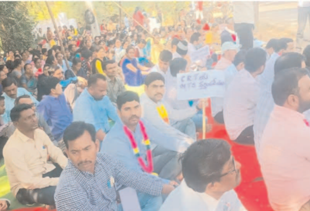
నర్సీపల్లెల క్రమబద్ధకరించాలి. ప్రతి నెల ఒకటో తేదీన గ్రీన్ ఛానల్ ద్వారా వేతనాలు చెల్లించాలి. మహిళ సిఆర్పీలకు వేతనంతో కూడిన ఒక్కో 180 రోజుల ప్రసూతి సెలవులు

వాస్తవ నేస్తం, ఆదిలాబాద్ జ్యూరీ : సమగ్ర గిరిజన అభివృద్ధి సంస్థ ఉట్నూరు (బిడిడి) పరిధిలోని ప్రభుత్వ పాఠశాలలో విధులు నిర్వహిస్తున్న సిఆర్పీలకు రాష్ట్రప్రభుత్వం ఉద్యోగ భద్రత కల్పించి ఆదుకోవాలని ఉమ్మడి జిల్లా సిఆర్పీలు డిమాండ్ చేశారు. తమ సమస్యల పరిష్కరించాలని కోరుతూ ఈనెల 16 నుంచి ఉట్నూరు లోని బిడిడి కార్యాలయం ఎదుట చేపట్టిన నిరధిక సమ్మె బుధ వారం మూడో రోజుకు చేరుకుంది. తమ డిమాండ్లు నెరవేర్చే వరకు సమ్మె కొనసాగుతుందని సిఆర్పీలు స్పష్టం చేశారు. ఉమ్మడి ఆదిలాబాద్ జిల్లా వ్యాప్తంగా 123 ఆశ్రమ పాఠశాలలు, 904 గిరిజన ప్రాథమిక పాఠశాలలో ఉన్నాయి. ఇందులో 1200 మంది సిఆర్పీలు వివిధ నిర్వహిస్తున్నారని చెప్పారు. గత కొన్నేళ్లుగా అరకోర వేతనాలతోనే పని చేస్తున్నామని, తమ న్యాయమైన డిమాండ్లను రాష్ట్ర కాంగ్రెస్ ప్రభుత్వం పరిష్కరించి న్యాయం చేయాలని వారు కోరారు. రాష్ట్ర ప్రభుత్వం ఏర్పడి ఏడాది దాటిినా, ఎన్నికల ముందు సీఎం రేవంత్ రెడ్డి ఇచ్చిన హామీల ను నేటికీ నెరవేర్చలేకపోతున్నారని వారు ఆవేదన వ్యక్తం చేశారు. వినతిపత్రాలు, వివిధ రూపాల్లో నిరసన తెలిపినప్పటికీ ప్రతిపక్షోచేదం లేదని వాపోయారు.