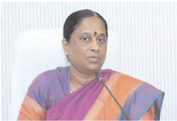
ప్రభుత్వం పట్టించుకోలేదని ఆరోపించారు. విద్యార్థిని మృతిని రాజకీయం చేయవద్దని కోరారు. అందుకే కేటీఆర్ పదేపదే జైలుకు పోతా అంటున్నాడు

బీఆర్ఎస్ నేత ఆర్ఎస్ ప్రవీణ్ కుమార్ పై మంత్రి కొండా సురేఖ సంచలన ఆరోపణలు చేశారు. గురుకులాల్లో కుట్రలు వెనుక ఆర్ఎస్ ప్రవీణ్ కుమార్ హస్తం ఉందని ఆమె ఆరోపించారు. గతంలో ఆయన గురుకులాల కార్యదర్శిగా పని చేశారని గుర్తు చేశారు. తన అనుచరులనే నిబ్బందిగా నియమించుకున్నట్లు చెప్పారు. ఈ నేపథ్యంలో గురుకులాల కుట్రలు వెనుక ఆయన హస్తం ఉందన్నారు. ఈరోజు ఆమె మీడియాతో మాట్లాడుతూ... సంక్షేమ హాస్టళ్లను గత ప్రభుత్వం పట్టించుకోలేదన్నారు. హాస్టళ్లలోని విద్యార్థులను ఉత్తమ విద్యార్థులుగా తీర్చిదిద్దే బాధ్యత ప్రభుత్వానిదే అన్నారు. తమ ప్రభుత్వం వచ్చాక హాస్టళ్లలో ఓ విద్యార్థిని చనిపోయిందన్నారు. బాధిత విద్యార్థిని ప్రత్యేక వైద్య సదుపాయం అందించామన్నారు. దురదృష్టవశాత్తూ చనిపోయిందన్నారు. ఆమె మృతిపై రాజకీయం చేయవద్దని కోరారు. బీఆర్ఎస్ హయాంలో హాస్టళ్లలో భోజనంలో పురుగులు వచ్చేవన్నారు. సంక్షేమ హాస్టళ్లలో సదుపాయాలు కొరవడినా బీఆర్ఎస్