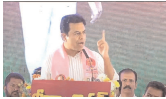
హైదరాబాద్ : తెలంగాణలో ఉన్న కాంగ్రెస్ ప్రభుత్వం లేకీ బుద్ధితో వ్యవహరిస్తోందని బీఆర్ఎస్ వర్గం ప్రెసిడెంట్ కేటీఆర్ నిప్పులు చెరిగారు. దీక్షా దివస్ సంధర్భంగా తెలంగాణ భవన్ లో కేటీఆర్ ప్రసంగించారు. ఈ కాంగ్రెస్ ప్రభుత్వం లేకీ బుద్ధితో వ్యవహరిస్తోంది.. బంజారా ఆడబిడ్డలు తమ వేషధారణలో సంప్రదాయంగా దీక్షా దివస్ లో పాల్గొనడానికి వస్తుంటే క్యాన్సర్ హాస్పిటల్ నుంచి ఇక్కడి వరకు వీధి దీపాలు ఆర్పితారు. అంతేకాకుండా బీఆర్ఎస్ షెక్కిలు చింపేశారు. ఈ ప్రభుత్వానిది లేకీ బుద్ధి అని అర్థమవుతోంది. కాంగ్రెస్ తన చిల్లర బుద్ధిని రుజువు చేసుకుంది. మనం ఎవర్నో తిట్టడానికి విమర్శించడానికి ఈ కార్యక్రమం పెట్టుకోలేదు అని కేటీఆర్ తెలిపారు. నిన్న ఏదారిలో నడిచి వచ్చామో తెలుసుకోకపోతే రేపు ఏ బాటలో నడవాలో అర్థం కాదు. కాబట్టి చరిత్రలను అర్థం చేసుకోకుండా భవిష్యత్ ను నిర్మించలేం. గతం తెలుసుకోకుండా గమ్యాన్ని చేరుకోలేం. ఈ తరం పిల్లలకు తెలంగాణ ఉద్యమ చరిత్ర, కేటీఆర్ భూమిక తెలియజేపే బాధ్యత మనందరిది. ఇప్పటి తరానికి తెలంగాణ సాధించిన వ్యక్తిగా, తాటి ముఖ్యమంత్రిగా కేటీఆర్ తెలియజేపారు. కానీ పోరాటాలు, త్యాగాల చరిత్ర, విద్యార్థి అమరవీరుల త్యాగం కూడా తెలియాలని కేటీఆర్ అన్నారు.

-మొదటిపేజీ తరువాయి స్వత్య రూపాలు, చిత్రకళలు, చరిత్ర పాఠాలు, శిలాశాసనాలు ఎన్నెన్నో రకాలుగా ఘనమైన సంస్కృతిని, మహనీయులను, వైతాళికులను గుర్తు చేసుకునే విధంగా మనకు ఉపయోగపడ్డాయని కేటీఆర్ తెలిపారు. ఏ జాతి అయితే తన చరిత్రను విస్మరిస్తుందో ఆ జాతి పరాయి పెత్తనంలో బానిసగా మారిపోతుంది. ఒక ప్రాంతాన్నో ఒక దేశాన్నో ఓడించి వశం చేసుకున్న విజేతలు.. పరాజితుల చరిత్రను చెరిపేసే ప్రయత్నం చేస్తారు. మానసిక దాడి చేసి లొంగదీసుకునే ప్రయత్నం చేస్తారు. బ్రిటిష్ వారి నుంచి మొదలుకుంటే సమైక్యార్థ శక్తుల దాకా ఇదే ప్రయోగం చేశారు. తెలంగాణ భావజాలం మీద కూడా అనేక దాడులు జరిగాయి. ఆంధ్రా %- % తెలంగాణ పంచాయతీలు, హైదరాబాద్ అట్టుడికిపోతుందని, తెలంగాణ నాయకత్వానికి పరిపాలన సమర్థత లేదని దాడి జరిగింది. కానీ వాటన్నింటినీ పటాపంచలు చేస్తూ కేటీఆర్ ముఖ్యమంత్రిగా భారతదేశంలో తెలంగాణ నవంబర్ వన్ గా నిలబెట్టారు అని కేటీఆర్ గుర్తు చేశారు. ఒక జాతి సంక్షోభంలో ఉన్నప్పుడు తల్లిదిల్లుతున్నప్పుడు ఒక యోధుడు పుడుతారు. ఆ యోధుడు స్వాధీనం, గాంధీ, మార్టిన్ లూథర్ కింగ్, నెల్సన్ మండేలా.. ఎవరో ఒకరు వుడ్డి.. ఆ జాతిని మేల్కొల్పి తదిది మళ్లీ తిరిగి స్వాతంత్ర్యం సాధించుకున్నారు. ప్రతి దేశానికీ, ప్రాంతానికీ, జాతికి ఒక