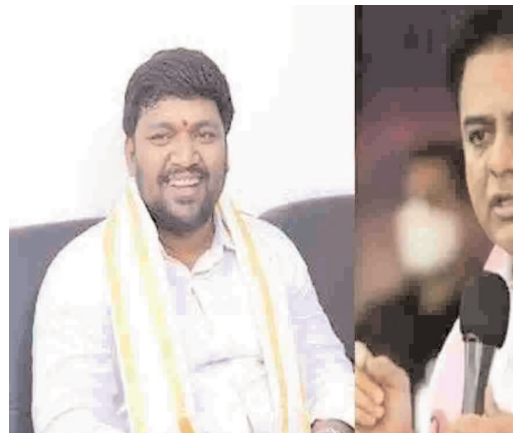
చెప్పకుండా ఉంటాడా అని ప్రశ్నించారు. కేసీఆర్ అబద్ధాల రికార్డు బ్రేక్ చేసిందకు కేటీఆర్ కష్టపడుతున్నారని అన్నారు. తమ హయాంలో చేసిన పనిని కేంద్ర ప్రభుత్వం గుర్తిస్తే అది తమ ఘనత అంటూ కేటీఆర్ చెప్పకుంటున్నారని