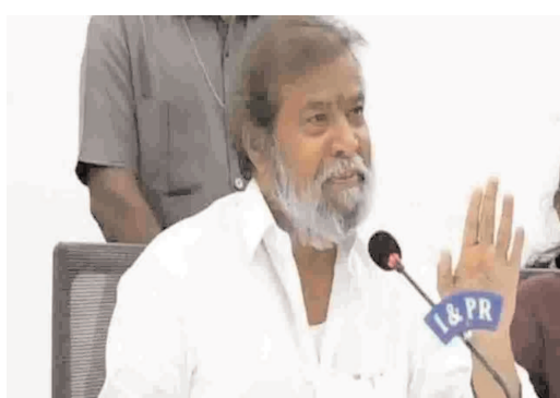
రాజనర్సింహ తలపారు. ప్రతి ఆస్పత్రులో ఫైర్ అలార్మ్, స్ట్రాక్ట్ డిటెక్టర్స్ ఉన్నాయా లేవా అనేది పరిశీలించాలని అధికారులకు మంత్రి చెప్పారు. ప్రమాదవశాత్తూ అగ్నిప్రమాదాలు సంభవించి మంటలు ఏర్పడితే ఆర్పే యంత్రాలు సరిపడా ఉన్నాయా, లేవో? చూడాలని.. వాటి తుది గడువు తేదీలను

చేయాలని ఆయన స్పష్టమైన ఆదేశాలు జారీ చేశారు. ఆస్పత్రుల్లో అగ్నిప్రమాదాల నివారణపై ఆరోగ్యశాఖ అధికారులతో మంత్రి రాజనర్సింహ సమీక్ష నిర్వహించారు. ఈ సందర్భంగా ఇటీవల ఉత్తర ప్రదేశ్ రాష్ట్రం రూస్సీలోని మహారాణి లక్ష్మీబాయి మెడికల్ కాలేజీ అగ్నిప్రమాదంపై రాజనర్సింహ తీవ్ర దిగ్భ్రాంతి వ్యక్తం చేశారు. ఆ ప్రమాదంలో 10మంది చిన్నారులు మృతిచెందడంపై మంత్రి ఆవేదన వ్యక్తం చేశారు. ఈ సందర్భంగా రాజనర్సింహ అధికారులను ఆప్రమత్తం చేశారు. ఇలాంటి ఘటనలు తెలంగాణలో చోటు చేసుకోకుండా చూడాలని, అందుకు ముందుగానే అన్ని ఆస్పత్రుల్లో ఫైర్ సేఫ్టీపై తనిఖీలు చేయాలని అధికారులను ఆదేశించారు. తనిఖీల కోసం వెంటనే పది బృందాలను ఏర్పాటు చేయాలని సూచనలు జారీ చేశారు. తొలుత గాంధీ, ఉస్మానియా, నీలోఫర్, ఎలెజిం వంటి పెద్దపెద్ద ఆస్పత్రుల్లో తనిఖీలు చేసి నివేదికలు తనకు అందించాలని మంత్రి