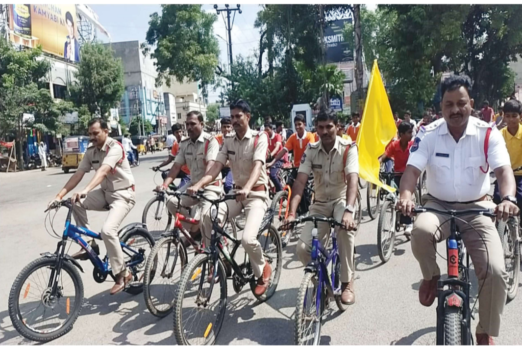
ఉన్నతాధికారుల ధృష్టికి తీసుకురావాలన్నారు. చెడు వ్యసనాలకు, చెడు స్నేహాలకు అలవాటు పడి, విధులలో నిరక్షణం వహించినట్లైతే, పోలీస్ శాఖ ప్రతిష్ఠకి భంగం కలిగించే విధంగా ప్రవర్తించరాదని హెచ్చరించారు. మరియు రెగ్యులర్ గా హెల్త్ చెక్ అప్స్ చేయించుకోవాలన్నారు. వ్యాయామాన్ని నిత్య జీవితంలోనూ భాగం చేసుకోవాలన్నారు. మరియు సమయం దొరికినప్పుడు భార్య పిల్లలతో