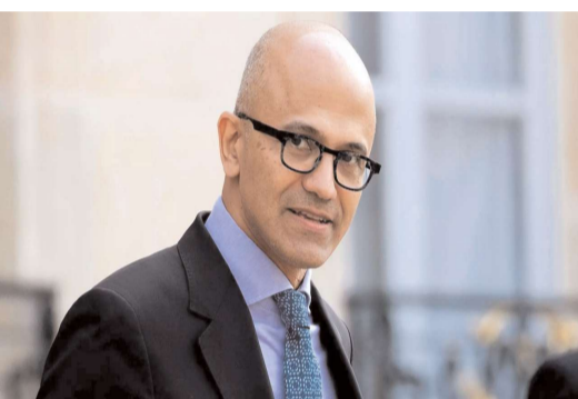
ఆర్థిక సంవత్సరంలో మైక్రోసాఫ్ట్ గణనీయమైన వృద్ధి సాధించింది. దీంతో కంపెనీ షేర్లు 31.2 శాతం లాభపడ్డాయి. అలాగే మైక్రోసాఫ్ట్ మార్కెట్ విలువ 3 త్రిలియన్ డాలర్లు దాటింది. దీంతో సత్య నాదెళ్ల స్టాక్ అవార్డులు 38 మిలియన్ డాలర్ల నుంచి 71 మిలియన్ డాలర్లకు పెరిగాయి. కృత్రిమే మేధ(ఏఐ) రేసులో రాజీంచేందుకు కంపెనీ

న్యూఢిల్లీ : సత్యనాదెళ్ల.. ప్రముఖ టెక్ సంస్థ మైక్రోసాఫ్ట్ సీఈవో. దాదాపు ఐదేళ్లుగా ఆయన ఈ హోదాలో కొనసాగుతున్నారు. కంపెనీ సీఈవో కావడానికి ఎంత క్రమించాలో.. సీఈవోగా ఇప్పుడు కంపెనీ వృద్ధికి అంతకన్నా రెండింపుస్థాయిలో పనిచేస్తున్నారు. అయితే ఇటీవల తెచ్చిన చాట్జీపీటీతో కాస్త ఇబ్బంది పడినా.. బోర్డు సత్యనాదెళ్లపై పూర్తి విశ్వాసం వ్యక్తం చేసింది. దీంతో ప్రస్తుతం సీఈవోగా ఆయనే కొనసాగుతున్నారు. తాజాగా సత్యనాదెళ్ల జీతం పెరిగింది. 2024 ఆర్థిక సంవత్సరంలో ఆయన 79.1 మిలియన్ డాలర్ల వేతనం అందుకోనున్నారు. అంటే మన భారతీయ కరెన్సీలో రూ.664 కోట్లు అన్నమాట ఈ విషయాన్ని కంపెనీ తన రెగ్యులేటరీ ఫైలింగ్లో పేర్కొంది. 2023 ఆర్థిక సంవత్సరంలో సత్యనాదెళ్ల వేతనం 48.5 మిలియన్ డాలర్లు. భారత కరెన్సీలో రూ.407 కోట్లు. ఈ ఏడాది సత్య నాదెళ్ల వేతనం 63 శాతం పెరిగింది. దీతో ఆయన 79.1 మిలియన్ డాలర్లు. భారత కరెన్సీలో రూ.667 కోట్లు అందుకోనున్నారు. గత జూన్తో ముగిసిన