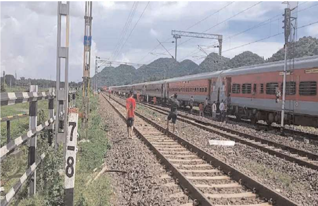
దిమ్మెలు, ఇసుక దిబ్బలు ఉన్నాయి. ఇలాంటి ఘటనలు ఎక్కువగా ఉత్తరప్రదేశ్లోనే వెలుగు చూడగా.. ఆ తర్వాత పంజాబ్, జార్ఖండ్, రాజస్థాన్, మధ్యప్రదేశ్, ఒడిశా, తెలంగాణ రాష్ట్రాల్లో ఈ ప్రమాదాలు జరిగినట్లు రైల్వే శాఖ అధికారులు వివరించారు. ఇక జూన్ 2023 నుంచి ఇప్పటి వరకూ ఈ తరహా ఘటనలు 24 జరిగినట్లు తెలిపారు.

దేశంలో రైలు ప్రమాదాలకు దారి తీసేలా కుట్రపూరిత ప్రయత్నాలు అందోళన కలిగిస్తున్నాయి. ట్రాక్పై గ్యాస్ సిలిండర్లు, ఇసుక పట్టీలు ఉంచుతూ రైళ్లను పట్టాలు తప్పించేందుకు కుట్రలు పన్నుతున్నారు. ఉత్తరప్రదేశ్, గుజరాత్ సహా పలు రాష్ట్రాల్లో ఇప్పటికే ఇలాంటివి అనేక ఘటనలు వెలుగుచూశాయి. తాజాగా మరో కుట్ర బయటపడింది. ఉత్తరప్రదేశ్లోని మలిహాబాద్ రైల్వే స్టేషన్ సమీపంలో ట్రాక్పై దుండగులు చెక్క దిమ్మెను ఉంచారు. అక్టోబర్ 24న ఈ ఘటన చోటు చేసుకుంది. ఆ సమయంలో 14236 నంబర్ గల బరేలీ - వారణాసి ఎక్స్ప్రెస్ రైలు పైలెట్ ట్రాక్పై ఉన్న 6 కిలోల కంటే ఎక్కువ బరువున్న రెండు అడుగుల పొడవైన చెక్క దిమ్మెను గుర్తించారు. వెంటనే అత్యవసర క్రోకేట్ వేశారు. దీంతో పెను ప్రమాదం తప్పింది. ఈ ఘటనతో దాదాపు రెండు గంటల పాటు ఆ మార్గంలో రైళ్ల రాకపోకలు నిలిచిపోయాయి. రంగంలోకి దిగిన అధికారులు ట్రాక్పై ఉన్న వాటిని తొలగించారు. ఆ తర్వాత భద్రతా తనిఖీల అనంతరం రైళ్ల రాకపోకలను పునరుద్ధరించారు. ఈ ఘటనపై రైల్వే ప్రొటెక్షన్ ఫోర్స్ ఎఫ్ఐఆర్ నమోదు చేసి దర్యాప్తు చేపట్టింది. ఇటీవలే దేశవ్యాప్తంగా రైళ్లను పట్టాలు తప్పించేందుకు అనేక కుట్రలు జరిగిన విషయం తెలిసింది. రైలు ట్రాక్పై వివిధ రకాల వస్తువులను అధికారులు గుర్తించారు. వీటిలో ఎల్పీజీ సిలిండర్లు, సైకిళ్లు, ట్రాక్టర్లు, ఇసుక రాడ్లు, సిమెంట్