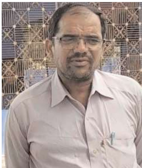
చేసిన తర్వాత జిల్లా గ్రామీణ అభివృద్ధి అధికారి ధృష్టికి తీసుకుపోవడం జరిగింది. జిల్లా గ్రామీణ అభివృద్ధి అధికారి అమ్మాయిపల్లి గ్రామంలో జరిగిన మహిళా సంఘాలలో జరిగిన అవకాశపకలపై విచారణ చేయాలని అధికారులతో కూడిన ఒక కమిటీ ఏర్పాటు చేయడం జరిగింది. ఆ