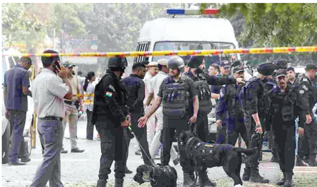
ప్రాంతంలోని సీఆర్పీఎఫ్ పాఠశాల సమీపంలో జరిగిన పేలుడు ఘటనపై విచారణ ముమ్మరం చేశారు. ఘటనా స్థలంలో ముమ్మరంగా తనిఖీలు సాగించడంతో పాటు సీసీటీవీ కెమెరాలతో నిఘా, ఎన్ఎస్ఐజీ రోజులను మోహరించారు. అక్టోబర్ నెలలో పలు విద్యా సంస్థలకు బాంబు బెదిరింపులు రావడాన్ని కూడా సీరియస్గా పరిగణిస్తున్నారు. అక్టోబర్ 4న

బెంగళూరులోని మూడు ఇంజనీరింగ్ కాలేజీలకు బాంబు బెదిరింపు ఈ-మెయిల్స్ వచ్చాయి. దానికి ముందు తొమ్మిది విద్యాసంస్థలకు బాంబులు పెట్టామంటూ ఈ-మెయిల్స్ వచ్చాయి. పోలీసుల తనిఖీల్లో ఇవి ఉత్పత్తి బెదిరింపులే అని తేలాయి.