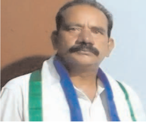
ప్రజలను మోసం చేసి గడ్డె ఎక్కి ఏ ఒక్కటి హామీ నెరవేర్చలేని ఈ ప్రభుత్వం మేము ప్రజల కోసం సేవ చేస్తామని ప్రజల