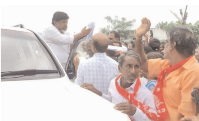
వర్షపు నీరు చేరుతుందన్నారు. గ్రామంలో పారిశుధ్య, డ్రైనేజీ, విద్యుత్ సమస్యలు తీవ్రంగా ఉన్నాయని వాటిని పరిష్కరించాలని కోరారు. రోడ్డుకు ఇరువైపులు సైడ్ డ్రెస్సు ఏర్పాటు చేసి వర్షపు నీరు చెరువులోకి వెళ్లాలి చర్యలు తీసుకోవాలని కోరారు.