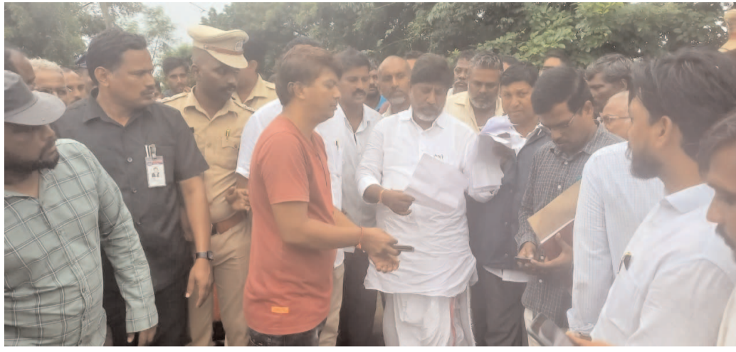
అడిగినా లైన్ ఇన్స్పెక్షన్ పై, వినియోగదారుని తప్పుదోవ పట్టించిన ఏ ఈ దరఖాస్తు రూపంలో తగిన చర్యలు తీసుకోవాలని ఫిర్యాదు చేశారు.

వాస్తవ నేస్తం,బోనకల్: కరెంటు కావాలంటే అడుగుతున్నారని, లైన్ ఇన్స్పెక్షన్ పై వినియోగదారుని తప్పుదోవ తప్పుదోవ పట్టిస్తున్నారని ఆరోపిస్తూ ఏకా పై తగిన చర్యలు తీసుకోవాలని రావినూతలకు చెందిన గుగులోతు మురళి డిప్యూటీ సీఎం బడ్జెట్ వికేంద్రకు విద్యుత్ శాఖ అధికారులపై ఫిర్యాదు చేశారు. గుగులోతు మురళి తెలిపిన వివరాల ప్రకారం... సెకండ్ క్యాటగిరి మీటర్ కోసం దరఖాస్తు చేసుకోగా లైన్ ఇన్స్పెక్షన్ ఆన్లైన్ విధానం వచ్చిన తర్వాత కరెంటు స్తంభం నుంచి 30 మీటర్ల లోపు ఉంటేనే కనెక్షన్ ఇస్తామని లేకపోతే 3000 రూపాయలు ఇస్తే దరఖాస్తు పై సంతకం పెడతానని డబ్బులు అడిగాడు నేను ఇవ్వలేనని అనడంతో ఏ ఈ తో మాట్లాడుకోండి అని చెప్పడంతో ఏఈ వద్దకు వెళ్లడంతో ఇవ్వడం కుదరదని తమ సంతకం లేకపోయినా ఆన్లైన్ చేసుకోవచ్చు అని వినియోగదారుడు అయినటువంటి మురళి ని తప్పుదోవ పట్టించారు, బోనకల్ మండల పర్కలనుకు వచ్చిన డిప్యూటీ సీఎం కు డబ్బులు