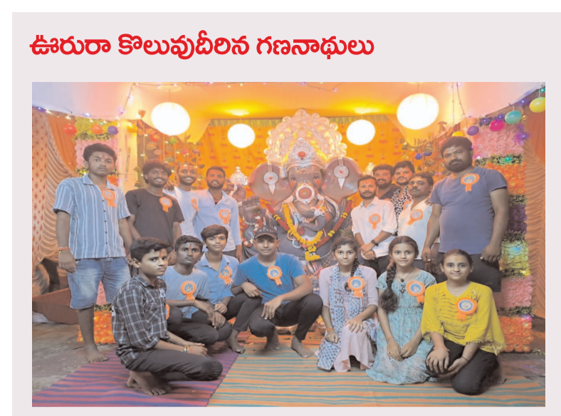
వాస్తవ నేస్తం,గుడిపాతూర్: మండల కేంద్రంలోపాటు అయా గ్రామాల్లో వాడవాడలా వినాయక మండపాల నిర్మాణాలు గణనాథులు కొలు తీర్చారు. వినాయక చవితి పురస్కరించుకొని శనివారం అనేకమంది ఇళ్లలోనూ వినాయకుడిని పూజించారు. గణపతి సవరాత్రి సందర్భంగా 11రోజుల పాటు గణనాథుడిని పూజించేందుకు గణపతి విగ్రహాలను ఊరేగింపుగా తీసుకువెళ్లి శోభ యామానంగా అలంకరించి మండపాలలో శాస్త్రోక్తంగా విగ్రహాలను ప్రతిష్ఠించారు. గణనాథుని పూజ చేయటానికి ఉదయం నుంచి భక్తులు పూజారి కార్యక్రమంలో సిద్ధం చేసుకుని పూజలు చేశారు.