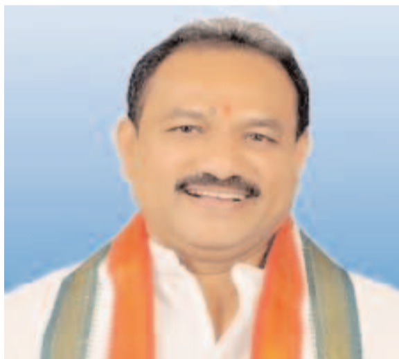
ప్రకటించిన ఏపీసీ ప్రధాన కార్యదర్శి కేసీ వేణుగోపాల్ జూలై 7లో ముగిసిన రేవంత్ రెడ్డి వీసీసీ అధ్యక్ష పదవీ కాలం