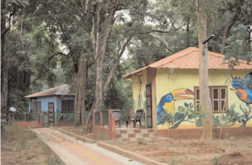
విషయం వ్యక్తం చేసిన ఆమె, ఈ స్థాయిలో అటవి సంపద విద్యుంసం జరగడం ఎప్పుడూ లేదన్నారు.

తాడ్వాయి ఫారెస్ట్ సంగతి వరంగల్ : ములుగు జిల్లాలో టోర్నడో తరహా గాలులు బీభత్సం సృష్టించాయి. దీంతో ఏటవారు నాగారం మండలం కొండాం నుంచి మేదారం మీదుగా తాడ్వాయి మండలం