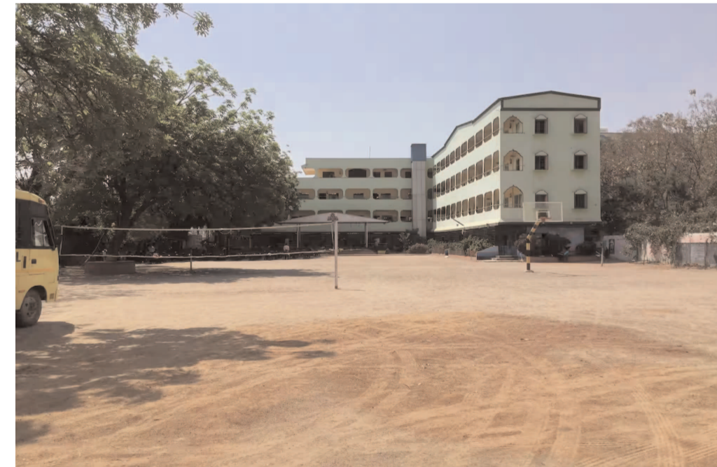
వేయించిన క్రొద్ది రోజులకే కరోనా మహమ్మారి సోకడంతో దేశవ్యాప్తంగా లాక్ డౌన్ వచ్చిందని అన్నారు.

కరీంనగర్ : రైలు బోగీని తలపించే విధంగా ఈ పాఠశాల ముందు పెయింట్ లోనే ఉంటుంది...ఆది చూస్తే ఇళ్ల మధ్యలో రైలు ఉంది ఏంటి అనుకుంటున్నారేమో... అలా అనుకుంటే ముమ్మాటికి తప్పి... ఇది రైలు బోగీని తలపించే