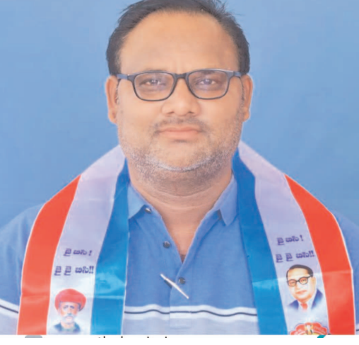
మంథని నియోజకవర్గాన్ని ఎడ్యుకేషన్ హబ్ గా మార్చిన ఘనత మంత్రి దుద్దిల్ల శ్రీధర్ బాబుదే