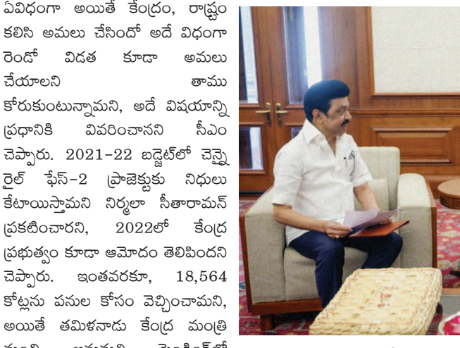
చేయాలని ప్రధానిని కోరినట్లు చెప్పారు. తమిళ మత్స్యకారుల ప్రయోజనాలను కాపాడేందుకు ప్రధాని జోక్యం చేసుకోవాలని, సమగ్ర శిక్షా పథకం కింద కేంద్ర నిధులను తమిళ నాడుకు విడుదల చేయాలని కూడా కోరినట్లు తెలిపారు.

న్యూఢిల్లీ: ప్రధాన మంత్రి నరేంద్ర మోదీని డీఎంకే అధ్యక్షుడు, తమిళనాడు ముఖ్యమంత్రి ఎంకే స్టాలిన్ శుక్రవారంనాడు ఢిల్లీలో కలుసుకున్నారు. 'సమగ్ర శిక్షా స్కీమ్' కింద కేంద్ర నిధులు విడుదల చేయాలని, 50:50 ఈక్విటీ పేర్ కింద చెన్నై మెట్రో రైల్ ప్రాజెక్ట్ ఫేజ్-2కు అనుమతి ఇవ్వాలని ప్రధానిని ఆయన కోరారు. భారత మత్స్యకారులకు సంప్రదాయంగా ఉన్న చేపటవేట హక్కులను పరిరక్షించాలని, సముద్ర జలాల్లో పట్టుకున్న తమిళ మత్స్యకారులు, వారి పడవలను తురితగతని విడిపించేందుకు చర్యలు తీసుకోవాలని కోరారు. ఈ మేరకు ఒక విజ్ఞాపన పత్రాన్ని ప్రధానికి స్టాలిన్ అందజేశారు. సుమారు 45 నిమిషాల పాటు ఉభయూలు భేటీ అయ్యారు. ప్రధానితో భేటీ అనంతరం మీడియాతో స్టాలిన్ మాట్లాడుతూ, సహజంగా ఇలాంటి సమావేశాలకు 15 నిమిషాలు సమయం ఇస్తారని, అయితే ఈసారి ఉభయూలు 45 నిమిషాల పాటు మాట్లాడుకున్నామని చెప్పారు. ఒక ముఖ్యమంత్రిగా తాను ఆయనను కలుసుకున్నానని, ప్రధానిగా ఆయన తమ వినతలను అలకించారని చెప్పారు. ప్రధానిగా ప్రధానికి మూడు వినతలు చేసినట్లు చెప్పారు. చెన్నై మెట్రోను