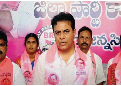
వేల కోట్లు నాశనమవుతే అలోచనలో ప్రభుత్వం..

అవస్థ గతంలో చెప్పిన మాట ప్రకారం.. ఫార్మా సిటీని రద్దు చేసిన మాట నిజమే అయితే.. ఆ భూములను రైతులకు తిరిగిచ్చే పని చేయాలి. అలా కాకుండా ఫోర్ట్ సిటీ కడుతా.. ఫిష్ట్ సిటీ కడుతా.. మా ఫోర్ట్ బ్రదర్స్ కు రియల్ ఎస్టేట్ దండాకు వాడుతా అంటే రైతులు ఊరుకోరు. ఏ రైతులైతే నీకు ఓటికారు.. వారో నీ పార్టీ అంత చూస్తారు. రేపు ప్రభుత్వం కోర్టులో సుప్రీంకు చెప్పాలి. లక్షలాది మందికి ఉపాధి కల్పించే ఫార్మా సిటీ కడుతున్నారా..? లేదా..? అదే విధంగా కోర్టు కూడా నోటీసు చేయాలని న్యాయమూర్తులకు విజ్ఞప్తి చేస్తున్నాను. ఫార్మా సిటీ కోసం ఏదేండ్లు కష్టపడి రైతులను ఒప్పించి, మెప్పించి.. నానా తంటాలు పడి సేకరించిన 14 వేల ఎకరాల్లో 64 వేల కోట్ల పెట్టుబడులు రావాలని లక్షలాది మంది ఉద్యోగ ఉపాధి అకాశాలు రావాలని ఫార్మాసిటీని ప్రతిపాదించామని కేటీఆర్ తెలిపారు.