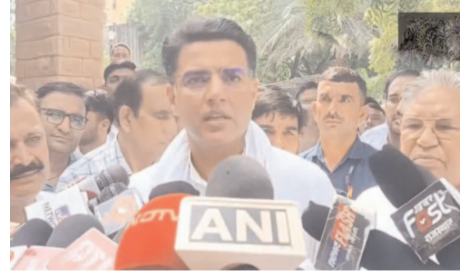
మిత్రపక్షాలనే గెలిపేస్తారని విశ్వసించారు.

మిత్రపక్షాలు భారీ మెజారిటీతో విజయం సాధిస్తాయని, ప్రభుత్వాలను ఏర్పాటు చేస్తాయని ఢిమా వ్యక్తంచేశారు. రెండు రాష్ట్రాల్లోనూ అధికార బీజేపీ ఓటమి ఖాయమని ఆయన జోస్యం చెప్పారు.