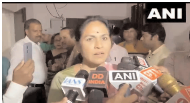
పదేపదే పల్లెవేస్తున్నారని రక్షణ మంత్రి తప్పుపట్టారు. రాహుల్ వ్యాఖ్యలు సిగ్గుచేటని, అవి దేశ ప్రతిష్టను దెబ్బతీసేలా ఉన్నాయని అన్నారు. భారత్ లో సిక్కులను గురుద్వారల్లో తలపాగాలను ధరించనియడం లేదని, తమ మతాచారాలను

అమెరికా పర్యటనలో కాంగ్రెస్ ఎంపీ, లోక్ సభ విపక్ష నేత రాహుల్ గాంధీ చేసిన వ్యాఖ్యలపై కాషాయ్ పార్టీ నేతలు భగ్గుమంటున్నారు. రాహుల్ గాంధీ పార్లమెంట్ లో విపక్ష నేతని, దేశం బయట ఆయన భారత ప్రతిపక్ష నేత కాదని కేంద్ర మంత్రి శోభా కరండ్లాజ్ అన్నారు. దేశం వెలుపల మనమంతా ఒక్కటేనని, ఆయన ఇలా ఎందుకు అర్థం చేసుకోలేకపోతున్నారని ప్రశ్నించారు. మంత్రి బుధవారం మీడియా ప్రతినిధులతో మాట్లాడుతూ రాహుల్ తీరును తప్పుపట్టారు. భారత్ ప్రతిష్టను మనకబార్చడం ద్వారా ఆయన ఉద్దేశం ఏంటని నిలదీశారు. దేశానికి వ్యతిరేకంగా ఏమైనా కుట్ర జరుగుతున్నదా తాము ఇలాంటి కుయ్యకులను సహించే ప్రసక్తే లేదని హెచ్చరించారు. ఇక అమెరికా పర్యటనలో రాహుల్ వ్యాఖ్యలను అంతకుముందు రక్షణ మంత్రి రాజ్ నాథ్ సింగ్ తీవ్రంగా ఖండించారు. రాహుల్ విదేశీ పర్యటనలో అధరహిత, నిరాధార, తప్పుదారి పట్టించే అవాస్తవాలను