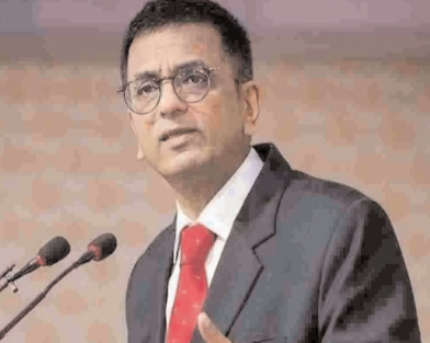
ఏం జరిగిందంటే.. హోల్.. నేను సుప్రీంకోర్టు ప్రధాన న్యాయమూర్తిని. తాను అత్యవసరంగా కోరితయిం సమావేశానికి హాజరుకావాల్సి ఉంది. కానీ కన్యూట్ షేన్ లో చిక్కుకుపోయాను. క్యాబ్ లో వెళ్తేందుకు తనకు రూ. 500 పంపండి. కోర్టుకు చేరుకోకానే.. ఆ సగదు తిరిగి పంపిస్తానంటూ స్పష్టం చేశారు. ఇది సోషల్ మీడియాలో వైరల్ అయింది. సోషల్ మీడియాలో ఈ నోట్ చూసి సాక్షాత్తు సుప్రీంకోర్టు ప్రధాన న్యాయమూర్తి జస్టిస్ డి. వై. చంద్రచూడ్ సైతం అవాస్తవ సంగతి తెలిసిందే.

కోల్ కతా : భారత ప్రధాన న్యాయమూర్తి జస్టిస్ డివై చంద్రచూడ్ ను కించపరిచేలా సోషల్ మీడియాలో తప్పుడు వార్తలను ప్రచారం చేశారనే ఆరోపణలపై వశ్చిమ బెంగాల్ లోని కృష్ణనగర్ సమీపంలోని పుల్పూరికి చెందిన సుజిత హార్దార్ పై కేసు నమోదు చేసినట్లు పోలీసులు బుధవారం వెల్లడించారు. ప్రధాన న్యాయమూర్తిని ఆగౌరవ పరచాలని అతడు ఉద్దేశ్య పూర్వకంగా ఈ విధంగా వ్యవహరిస్తున్నాడని తెలిపారు. అలాగే సుప్రీంకోర్టు గౌరవాన్ని సైతం సుజిత కింద పరిచేలా సోషల్ మీడియాలో ఫేక్ వార్తలను ప్రచారం చేస్తున్నాడన్నారు. ఈ కేసులో దర్యాప్తు కొనసాగుతుందని పోలీసులు పేర్కొన్నారు. సుప్రీంకోర్టు ప్రధాన న్యాయమూర్తికి వ్యతిరేకంగా సోషల్ మీడియాలో జరుగుతున్న ఈ ఫేక్ వార్తలను షేర్ చేయవద్దంటూ ఈ సందర్భంగా ప్రజలకు పోలీసులు విజ్ఞప్తి చేశారు. ఈ మేరకు ఎక్స్ వేదికగా కృష్ణనగర్ పోలీసులు స్పష్టం చేశారు. ఇటీవల.. సుప్రీంకోర్టు చీఫ్ జస్టిస్ డివై చంద్రచూడ్ లా ఓ వ్యక్తి తనను తాను పరిచయం చేసుకుంటూ క్యాబ్ ఛార్జీ కోసం సోషల్ మీడియాలో నగ్గు అడిగిన సంగతి తెలిసిందే. అందుకు సంబంధించిన స్ట్రీమ్ గ్రాబ్ సోషల్ మీడియాలో వైరల్ అయింది. ఈ ఘటనపై సుప్రీంకోర్టు రిజిస్ట్రే.. సైబర్ క్రైమ్ పోలీసులకు ఫిర్యాదు చేశారు.