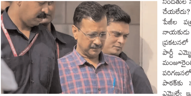
నిలిచారని సీబీఐ పేర్కొంది. అయితే సీబీఐ వాదనలను ఆమ్ ఆడ్మీ పార్టీ ఖండించింది. "లిక్కర్ స్వాం పేరు చెబుతూ..