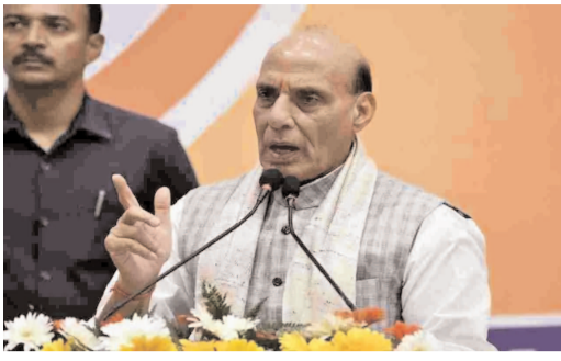
పూర్తిగా నిరాధారం, ఇందులో నిజం ఎంతమాత్రం లేదు" అని రాజ్ నాథ్ ఒక ట్వీట్ లో పేర్కొన్నారు. భారతదేశ సంస్కృతి పరిరక్షణలో సిక్కుల పాత్రను యావద్దేశం గుర్తించి, గౌరవిస్తుంటే వారి గురించి తప్పుడు ప్రకటనలు చేయడం

న్యూఢిల్లీ: కాంగ్రెస్ ఎంపీ, లోక్ సభలో ప్రతిపక్ష నేత రాహుల్ గాంధీ విదేశీ పర్యటనలో భాగంగా వర్ధినియాలో చేసిన ప్రసంగంలో సిక్కు మతస్తులు, రిజర్వేషన్లపై చేసిన వ్యాఖ్యలను కేంద్ర రక్షణ శాఖ మంత్రి రాజ్ నాథ్ సింగ్ తప్పుపట్టారు. రాహుల్ వ్యాఖ్యలు నిరాధారమని, తప్పుదారి పట్టించేలా ఉన్నాయని, సిగ్గుచేటని అన్నారు. మొహాబ్బత్ కీ దుకాణ్ నడుపుతున్నామని చెబుతున్న రాహుల్ ఇందుకు భిన్నంగా అబద్ధాల దుకాణం తెరిచారని వ్యంగ్యోక్తులు గుప్పించారు. "లోక్ సభలో ప్రతిపక్ష నేత రాహుల్ గాంధీ విదేశీ పర్యటనలో ప్రజలను తప్పుదారి పట్టించేలా అవాస్తవాలను చెబుతుంటుంటుంది. ఇది దేశ ప్రతిష్టను దెబ్బతీయడమే. భారతదేశం లోని సిక్కులను గురుద్వారాలలో తలపాగాలు ధరించేందుకు అనుమతించడం లేదని ఆయన చెబుతున్నారు. మత విధానాలను అచరించకుండా అడ్డుకుంటున్నారని అంటున్నారు. ఇది