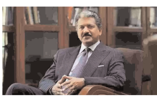
సాంకేతిక నైపుణ్యాలు నేర్పించున్నారు. ప్రభుత్వ ప్రైవేటు భాగస్వామ్యంతో పర్సనల్ నిర్వహణ..

వాషింగ్టన్: ఆగ్రాజ్యం అమెరికా పర్యటనలో ఉన్న తెలంగాణ ముఖ్యమంత్రి రేవంత్ రెడ్డి కీలక ప్రకటన చేశారు. తెలంగాణ ఏర్పాటు చేయబోతున్న యంగ్ ఇండియా స్కీల్ యూనివర్సిటీకి చైర్మన్ గా మహేంద్రా ఆండ్ మహేంద్రా గ్రూప్ చైర్మన్ ఆనంద్ మహేంద్రా పేరును ప్రకటించారు. ఆనంద్ మహేంద్రాను ఈ మేరకు నియమించబోతున్నట్లు అమెరికాలో సీఎం రేవంత్ రెడ్డి వెల్లడించారు. ఈ మేరకు ఐటీ, పరిశ్రమల శాఖ మంత్రి దుద్దిళ్ల శ్రీధర్ బాబు స్కీల్ పర్సనల్ బిల్లును శాసనసభలో ప్రవేశపెట్టారు. ఈ బిల్లుపై చర్చ జరిగింది. పర్సనల్ 17 కోర్టులు ప్రవేశపెట్టి, ప్రత్యేక శిక్షణ ఇవ్వనున్నట్లు ప్రభుత్వం ప్రకటించింది. యువత వద్ద కేవలం సర్టిఫికేట్లు మాత్రమే ఉంటే ఉద్యోగ, ఉపాధి అవకాశాలు దొరకడం కష్టంగా మారినదే విషయాన్ని గుర్తించిన తెలంగాణ ప్రభుత్వం.. పోటీ ప్రపంచానికి అనుగుణంగా నైపుణ్యాలు పెంపొందించడమే లక్ష్యంగా ఈ యూనివర్సిటీని ఏర్పాటు చేయబోతోంది. యూనివర్సిటీలో యువతకు