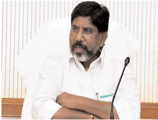
సానుకూల పనితీరును కనబరిచినందుకు సంతోషిస్తున్నామని అన్నారు. మొదటి క్వార్టర్లోనే ప్రాథమిక రంగం కింద బ్యాంకులు ఇప్పటివరకు 40.62% వార్షిక రుణ ప్రణాళికలో భాగంగా లక్షలన్నీ సాధించడం అభినందనీయం అన్నారు.

ప్రాధాన్యతాంశంగా పరిగణిస్తున్నారని భట్టి విక్రమార్కు ఇన్స్ట్రూమెంట్ పాలసీలతో ముందుకు వెళ్తున్నామన్నారు. ఇటీవల ముఖ్యమంత్రి రేవంత్ రెడ్డి, బి.టి. పరిశ్రమల శాఖ మంత్రి శ్రీధర్ బాబు ఆమెరికా, కొరియా దేశాల్లో పర్యటించారు. 36 వేల కోట్ల విలువైన ఎంఓఎలు కుదుర్చుకున్నారని డిప్యూటీ సీఎం వెల్లడించారు. సూక్ష్మ, మధ్యతరహా పరిశ్రమల ద్వారా పెద్ద సంఖ్యలో ఉపాధి కలుగుతుందని.. వారికి విరివిగా రుణాలు ఇచ్చి ప్రోత్సహించాలని బ్యాంకర్లను కోరారు. ఇందిరా మహిళా శక్తి పథకం కింద స్వయం సహాయక సంఘాలకు లక్ష కోట్లు వడ్డీ లేని రుణాలు రూపంలో ఇవ్వనున్నామని ఉపముఖ్యమంత్రి భట్టి విక్రమార్కు చెప్పారు. వారికి సహకరించి పారిశ్రామిక అభివృద్ధికి దోహదపడాలని బ్యాంకర్లకు సూచించారు భట్టి. 2024-25 ఆర్థిక సంవత్సరం మొదటి క్వార్టర్లో ప్రాధాన్యతా రంగాల అభివృద్ధికి వివిధ విభాగాల్లో బ్యాంకులకు