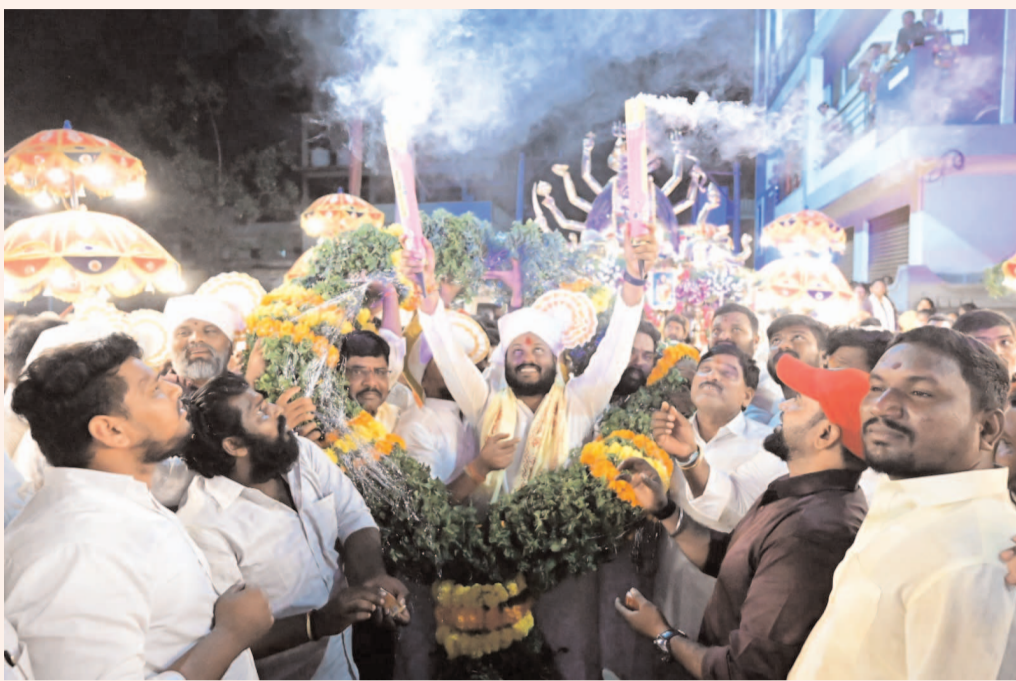
ఊరేగింపుగా తీసుకు వెళ్తున్న సమయంలో ఎన్ఎంఆర్ యువసేన సభ్యులు ధూమ్ ధామ్ గా ఆనందోత్సవాలతో దాన్సులు చేస్తూ జై మాతాది నినాదాలతో హెరాలించారు. ఈ ఫలహారం బండి ఊరేగింపులో పెద్ద ఎత్తున ప్రజలు పాల్గొని ప్రత్యేక పూజలు నిర్వహించారు.

వాస్తవ నేస్తం,పటాస్మైరు: ప్రతి రెండు సంవత్సరాలకు ఒకసారి చిట్టుల్లో జరిగే దుర్గమ్మ జాతర తో పాటు బోనాల ఉత్సవాలు ఘనంగా జరుగుతున్నాయి. మూడు రోజులపాటు జరగనున్న ఈ వేడుకలలో రెండవ రోజు ఎన్ఎంఆర్ యువసేన చిట్టుల్లో ఆధ్వర్యంలో నిర్వహించిన ఫలహారం బండి వేడుకలు ధూంధాం గా జరిగాయి. ఈ ఫలహారం బండి వేడుకలకు ఎన్ఎంఆర్ యువసేన భారీ ఏర్పాట్లను చేసింది. సాయంత్రం ఏడు గంటలకు సీలం మధు నివాసం నుంచి ప్రారంభమైన ఫలహారం బండి ఊరేగింపు చిట్టుల్లో పూరవీధుల మీదుగా సాగింది. ఫలహారం బండి ముందు ఏర్పాటుచేసిన ప్రత్యేక లైటింగ్,డీజీ సౌండ్ ఆకట్టుకున్నాయి. ఈ వేడుకలలో భాగంగా ఏర్పాటు చేసిన సాంస్కృతిక కార్యక్రమాలు, ప్రత్యేకంగా రప్పించిన కేరళ కళాకారుల నృత్యాలు, డిజై సౌండ్ లోని పాటలు అమాతులను విశేషంగా ఆకట్టుకున్నాయి. ఫలహారం బండి ఊరేగింపులో పోతురాజుల విన్యాసాలు చూపరులను లను అలరించాయి. ఉత్సవాల్లో ఏర్పాటుచేసిన బాణసంచా పేలుళ్లు ప్రత్యేక ఆకర్షణగా నిలిచాయి. పలారం బండి పై అమ్మవారి ప్రతిమను ఉంచి