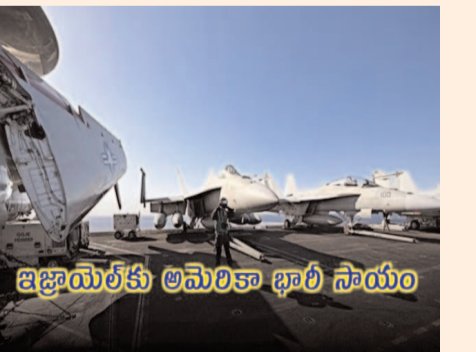
ఇజ్రాయెల్ కు అమెరికా భారీ సాయం

పశ్చిమాసియాలో యుద్ధమేఘాలు కమ్ముకున్న వేళ తాజాగా అమెరికా కీలక నిర్ణయం తీసుకుంది. ఇజ్రాయెల్ కు 20 బిలియన్ల దాల్చ విలువైన ఆయుధ వికర్యాల ఒప్పందానికి అమెరికా ఆమోదం తెలిపింది. ఆయనలో అనేక ఫైలర్ జెట్లు, 50పైగా ఎఫ్-15 ఫైలర్ జెట్స్, అధునాతన ఎయర్-టు-ఎయర్ క్షిపణులు, 120 ఎంఎం ట్యాంక్ మందుగుండు సాము, ఆధిక పేలుడు మోర్టార్లు ఉన్నాయి. ఈ మేరకు అమెరికా విదేశాంగ శాఖ ప్రకటన విడుదల చేసింది. అయితే, ఈ ఆయుధాలన్నీ ఎప్పుడు ఇజ్రాయెల్ కు చేరుకుంటాయనేది తెలియలేదు. వీటన్నింటినీ ఇజ్రాయెల్ కు అప్పగించడానికి కొన్నేళ్లు పట్టుకున్నట్లు సమాచారం. అమెరికా ఇప్పస్తున్న ఈ ఆయుధాలు ఇజ్రాయెల్ సైనిక సామర్థ్యాన్ని దీర్ఘకాలికంగా పెంచుకోవడానికి సాయపడనుంది. కాగా, ఇజ్రాయెల్ పై ప్రతీకార కాంక్షతో రగిలిపోతున్న ఇరాన్, దాడికి సిద్ధమైనట్లు వార్తలు వచ్చాయి. ఈ నేపథ్యంలో ఇజ్రాయెల్ ఆయుధ వికర్య ఒప్పందానికి యూఎస్ ఆమోదించడం గమనార్హం.