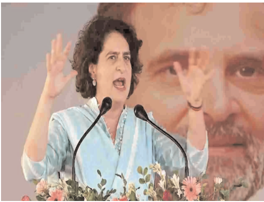
బెంగాల్ లోని వామపక్ష పార్టీల సైతం గొంతు కలిపాయి.

వెల్లవెచ్చిన విమర్శలు.. ప్రభుత్వ ఆధ్వర్యంలో నడిచే ఈ ఆసుపత్రిలో ఈ తరహా ఘటన చోటు చేసుకోవడంతో.. సర్దుబాటు విమర్శలు అయితే వెల్లవెచ్చుతున్నాయి. ఆ క్రమంలో దేశవ్యాప్తంగా వైద్య సిబ్బంది నిరసనకే సమైక్య పిలుపునిచ్చిన విషయం విధిచేతుంది. సంవత్సరం లేదా ఈ ఘటనపై సీబీఐతో విచారణ జరిపించాలని ఇప్పటికే బీజేపీ డిమాండ్ చేస్తుంది. దీనికి