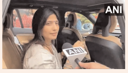
ప్రధాన అజెండా అని పేర్కొన్నారు. మరోవైపు విపక్ష ఇండియా కూటమి నుంచి పలువురు ఎన్డీయేలోకి వసూరిన ఎన్టీపీ ఎంపీ ప్రపుల్ పటేల్ సంవలన వ్యాఖ్యలు చేశారు.

ఎన్టీపీసీ అఖిలేష్ యాదవ్ సతీమణి ఆ పార్టీ ఎంపీ డింపుల్ యాదవ్ మంగళవారం 18వ లోక్ సభ సభ్యురాలిగా ప్రమాణ స్వీకారం చేశారు.