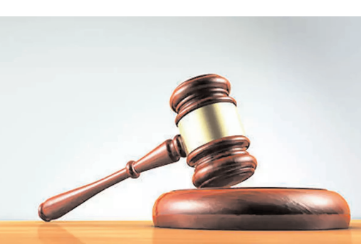
కేబిల్ ఆపరేటర్లపై ఒత్తిడి తీసుకువచ్చారని ఆరోపించింది. ఇక, ఎన్ టీవీ నుండి... ఏ అంశాలు ప్రసారం చేయాలన్న దానిపై న్యూస్ చానళ్లకు స్వతంత్రత ఉంటుందన్న విషయాన్ని రాజకీయ పార్టీలు గుర్తించాలని హితవు పలికింది.

ఏపీలో సాక్షి, టీవీ9, ఎన్టీవీ, 10టీవీ ప్రసారాలను పునరుద్ధరించాలంటూ ఢిల్లీ హైకోర్టు నేడు కీలక ఉత్తర్వులు జారీ చేసింది.