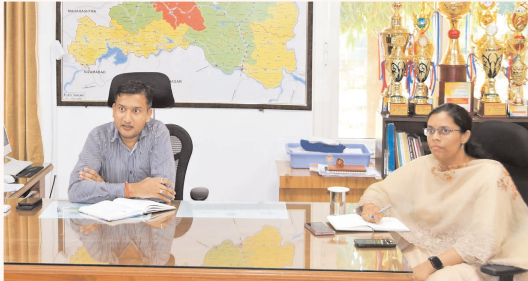
ఉత్పూర్ మండల పరిధిలోని అమ్మా ఆదర్శ పాఠశాల కమిటీ ద్వారా చేపడుతున్న నిర్మాణ పనులు, అడిషనల్ క్లస్ రూమ్ లు, ఏకరూప దుస్తులు, ఐటీడీఏ ద్వారా మేజర్ వర్క్