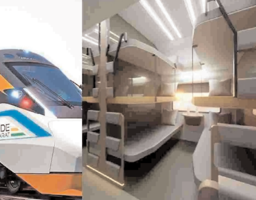
అభివృద్ధిని ప్రయోగించడం. న్యూఢిల్లీ నుంచి బయలుదేరే ఈ రైలు భోపాల్, సూరత్ మీదగా ముంబై చేరుకుంటుందని వివరించింది.

న్యూఢిల్లీ : మరీకాద్డి రోజుల్లో వందేభారత్ స్టీపర్ ఎక్స్ ప్రెస్ రైలు పట్టాలెక్కబోతుంది. ఆగస్ట్ 15న ప్రధాని నరేంద్ర మోదీ చేతులు మీదగా ప్రారంభంకానుంది.