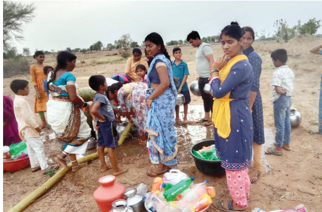
నుండి నీటి సరఫరా ఆగిపోవడంతో తండావాసులు తీవ్రంగా త్రాగునీటి సమస్యలు ఎదుర్కొంటున్నారు.

వర్షాకాలం వచ్చినా కూడా తప్పని త్రాగునీటి కష్టాలు త్రాగునీరు కోసం కిలోమీటర్ల మేర ప్రయాణం