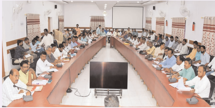
- జిల్లా పాలనాధికారి రాజ్ కిషోర్

వాస్తవ నేస్తం, ఆదిలాబాద్: అమ్మ ఆదర్శ పాఠశాలల్లో జరుగుతున్న కనీసం మౌలిక వసతులకు సంబంధించిన పనులను జూన్ 10 లోగా పూర్తిచేయాలని జిల్లా పాలనాధికారి ఆదేశించారు. కలెక్టరేట్ సమావేశం మందిరంలో శుక్రవారం ఏర్పాటు చేసిన సమావేశం వివిధ శాఖల అధికారులతో కలెక్టర్ అమ్మ ఆదర్శ పాఠశాలల్లో చేపడుతున్న పనులపై సమీక్షా సమావేశం నిర్వహించారు.