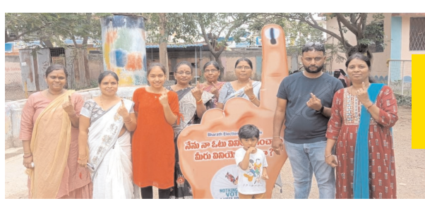
ఇచ్చోడ ఓటు హక్కును వినియోగించుకున్న ఓటర్లు