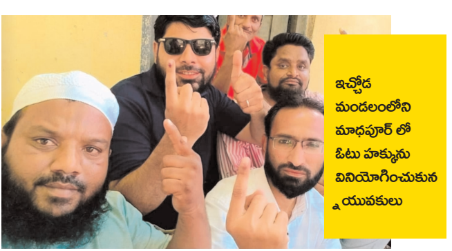
ఇచ్చోడ మండలంలోని మాధవపూర్ లో ఓటు హక్కును వినియోగించుకున్న యువకులు