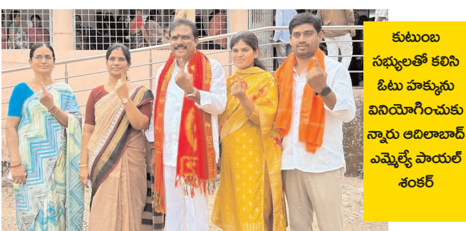
కుటుంబ సభ్యులతో కలిసి ఓటు హక్కును వినియోగించుకున్న ఆదిలాబాద్ ఎమ్మెల్యే పాయల్ శంకర్