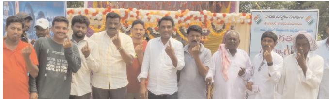
ఇచ్చోడ మండలంలోని అదోమ(కే) గ్రామంలో ఓటు హక్కును వినియోగించుకున్న గ్రామస్థులు

తెలంగాణ రాష్ట్ర వ్యాప్తంగా ప్రశాంతంగా పోలింగ్ ముగిసింది. ఎక్కడ ఎలాంటి సమస్యలు లేకుండా రాష్ట్రవ్యాప్తంగా ఓటర్లు తమ ఓటు హక్కును వినియోగించుకున్నారు. లా అండ్ ఆర్డర్ విషయంలో పోలీసుల సహకారం పూర్తిగా అందిందని ఎన్నికల ప్రధానాధికారి వికాస్ రాజ్ తెలిపారు. 2019తో పోలింగ్ ఐదు నుంచి 10 శాతం పోలింగ్ పెరిగి అవకాశం ఉంటుంది అన్నట్లుగా అంచనా వేస్తున్నారు ఎన్నికల అధికారులు. ఉదయం ఏడు గంటలకు ప్రారంభమైన పోలింగ్ సాయంత్రం 6 గంటల వరకు ఎక్కడ ఎలాంటి సమస్యలు లేకుండా జరిగింది. అయితే మావోయిస్టు ప్రభావిత ప్రాంతాలైన 5 పార్లమెంట్ స్థానాల్లోని 13 అసెంబ్లీ నియోజకవర్గాలైన అదిలాబాద్ పార్లమెంట్ లోని సిర్పూర్, ఆసిఫాబాద్, పెద్దపల్లిలో చెన్నూర్, బెల్లంపల్లి, మంచినాపల్లి, మంథని, వరంగల్ పార్లమెంట్ పరిధిలో భూపాలపల్లి, మహబూబ్ బాద్ పార్లమెంట్ పరిధిలో ములుగు, పినపాక, ఇల్లంపల్లి, భద్రాచలం, ఖమ్మం పార్లమెంట్ పరిధిలో కొత్తగూడెం, అశ్వారావుపేట లో సాయంత్రం నాలుగు గంటలకి ముగిసింది. ఆదిలాబాద్ జిల్లాలోని బాల్లిపేట్, దోగా గ్రామస్థులు తమ గ్రామంలో అభివృద్ధి పనులు జరగలేదని, తమ సమస్యలు పరిష్కారం అప్పటికే ఓటు వేయమని భీష్మించి కూర్చున్నారు. కాగా ఇల్లి విషయాన్ని తెలుసుకున్న అధికారులు గ్రామస్థులకు సన్నజెప్పి ఉన్నతాధికారులతో మాట్లాడిన సమస్యలు పరిష్కరించమని హామీ ఇవ్వడంతో ఓటింగ్ ప్రక్రియ అలస్యంగా ప్రారంభమైంది. వివిధ పార్టీల నుండి పోటీ చేసిన ఎంపీ అభ్యర్థులు, ఆయా నియోజకవర్గాల ఎమ్మెల్యేలు, రాజకీయ నాయకులు, యువతీ యువకులు, తమ ఓటు హక్కును వినియోగించుకున్నారు.