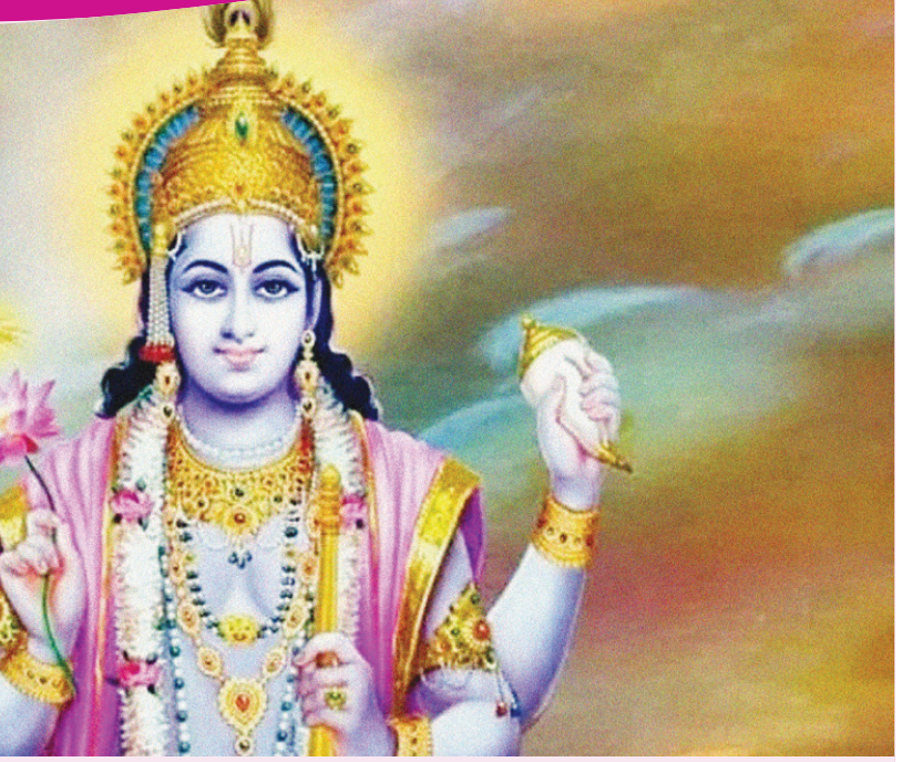
'ఓం మాధవాయ నమః' అనే మంత్రాన్ని జపించండి. ఇలా చేయడం వల్ల కుటుంబంలో ఉన్న కష్టాలన్నీ తొలగిపోయి ఇంట్లో ఐశ్వర్యం ఉంటుంది.

మాసాలలోకెల్లా ఉత్తమమైనదిగా పరిగణిస్తారు. ఈ మాసంలో విష్ణువు అవతారాలైన పరశురాముడు, నరసింహ, మాహా, కూర్మ అవతారాలను పూజిస్తారు. ఈ మాసంలో ప్రతిరోజూ 11 సార్లు