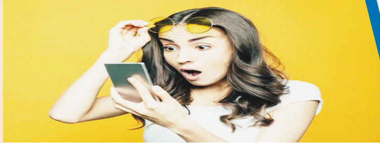
ఉండవచ్చు. నోమోఫోబియా ఇంకా అధికారికంగా మానసిక రుగ్మతగా పరిగణించబడలేదు, కాబట్టి దీనికి చికిత్స అందుబాటులో లేదు. అయితే, ఈ ఫోబియాను కొన్ని రకాల థెరపీ, కౌన్సెలింగ్తో అధిగమించవచ్చు.

కొద్దిసేపు ఫోన్కి దూరంగా ఉంటే చాలామందిలో వణుకు మొదలవుతుంటుంది. చెమటలు పట్టడం, తెలియని భయం ఉంటుంది. ఈ రోజుల్లో స్మార్ట్ఫోన్లు మన జీవితంలో ముఖ్యమైన భాగంగా మారాయి. ప్రతి చిన్న పెద్ద పనికి మనం దానిపై ఆధారపడుతున్నాం. ఒక్క క్షణం కూడా ఫోన్కు దూరంగా ఉండటమే కష్టంగా తయారైంది పరిస్థితి. మొబైల్ ఫోన్ దగ్గర లేకుంటే ఆందోళన కూడా మొదలవుతుంది. ఇలాంటి సమస్యను తేలికగా తీసుకోకూడదు. వైద్య పరిభాషలో దీనిని నోమోఫోబియా అంటారు. ఇది ఒక రకమైన మానసిక రుగ్మత. మొబైల్ దగ్గర లేకపోతే ఆందోళన అనుభవించడం ప్రారంభమవుతుంది. స్వాస్థ్యంలో మార్పు ఉంటుంది. ఆరోగ్య నిపుణులు అభిప్రాయం ప్రకారం, ఆందోళన మరియూ ఒత్తిడి కాకుండా, నోమోఫోబియా యొక్క అనేక ఇతర లక్షణాలు