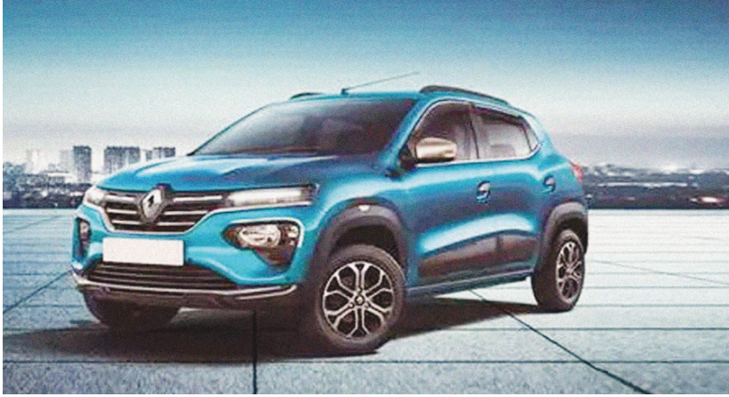
పొందొంది. కానీ ఇదే కంపెనీకి చెందిన గ్రాండ్ విటారా లీటర్ కు 27.97 కిలోమీటర్ల మైలేజ్ ఇస్తుంది. దీనిని రూ.18.43 లక్షల ప్రారంభ ధరతో విక్రయిస్తున్నారు. గ్రాండ్ విటారా 87 బీహెచ్ పీ పవర్ తో పాటు 122 ఎస్ ఎం టార్క్ ను ఉత్పత్తి చేస్తుంది. హెండా సీటీకి చెందిన వనజు

కొత్త కారు కొనుగోలు చేసేటప్పుడు కొందరు మైలేజ్ విషయంలో ఇంట్రస్ట్ పెడుతారు. ధర గురించి ఆలోచించకుండా మైలేజ్ ఎక్కువ ఇచ్చే కార్లు ఏవో తెలుసుకుంటారు. ఇప్పటి వరకు మారుమతి కంపెనీకి చెందిన ఆల్టో కే 10 పెట్రోల్ వేరియంట్ లో 22 కిలోమీటర్లు అత్యధికంగా మైలేజ్ ఇచ్చింది. దీనినిమించిన కారు లేదని చాలా మంది భావిస్తారు. కానీ ఆల్టో కంటే ఎక్కువ మైలేజ్ ఇచ్చే కార్లు ఉన్నాయి. ఇందులో ఉండే ఇంజన్ పవర్ తో దూసుకుపోతాయి. ఆ కార్ల వివరాలేవో తెలుసుకుందాం.. టయోటా కంపెనీ నుంచి ఆకట్టుకునే మోడళ్లు ఎన్నో వచ్చాయి. వీటిలో అర్బన్ కూజర్ వేరి ఇంప్రెస్ అన్నట్లుగా ఉంది. ఇందులో డ్యూయెల్ టోన్ కలర్స్, ఫాగ్ లైట్లు ఆకర్షణీయంగా ఉంటాయి. ఈ కాంపాక్ట్ ఎస్ యూపీ ట్యూన్ స్టాల్ గ్రేట్, ఫ్యాక్స్ బాల్, స్పిడ్ షేట్ తో పాటు 16 అంగుళాల డ్రైవర్ కే కే ఆల్టో వీల్స్ ఉన్నాయి. దీనిని రూ.16.66 లక్షల ప్రారంభ ధరతో విక్రయిస్తున్నారు. ఇది హైరైడర్ బలమైన హైబ్రిడ్ తో 27.97 కిలోమీటర్ల మైలేజ్ ఇస్తుంది. మారుమతి సుజాకి కార్లు ప్రత్యేకంగా ఉంటాయి. ఇప్పటి వరకు ఆల్టో మాత్రమే ఎక్కువ మైలేజ్ ఇచ్చే కారుగా గుర్తింపు