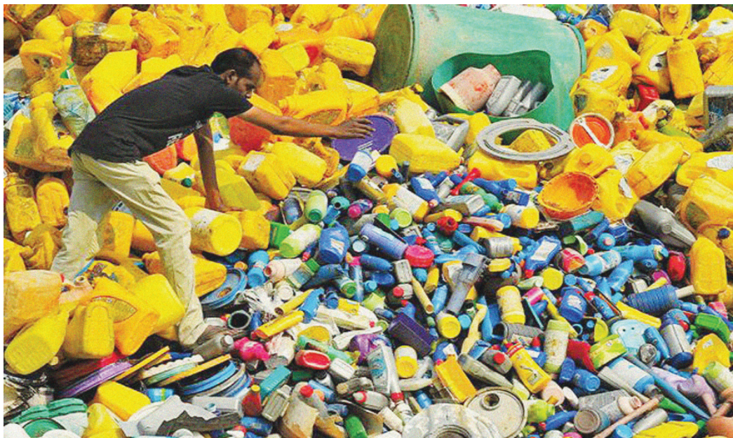
ఈ జాబితాలో అమెరికా, చైనా, భారత్, రష్యా, బ్రెజిల్, మెక్సికో, పాకిస్తాన్, ఇరాన్, ఈజిప్ట్, ఇండినేషియా, టర్కీ, వియత్నాం దేశాలున్నాయి. అయితే ఇతర దేశాలతో పోలిస్తే భారత్లో శుద్ధి చేయని ప్లాస్టిక్ వ్యర్థాలు 8 కిలోలు మాత్రమే. ఇది అమెరికా వ్యర్థాల్లో మూడోవంతు, చైనా వ్యర్థాల్లో ఐదో వంతు కన్నా తక్కువే. ప్లాస్టిక్ మినీ మేనేజ్మెంట్లో చైనా టాప్ లో ఉందని పేర్కొంది. తర్వాతి స్థానంలో అమెరికా ఉంది.

మానవాళి ఎదుర్కొంటున్న అతిపెద్ద సవాళ్లలో ఒకటి కాలుష్య భూతం. ముఖ్యంగా భూమి మీద గుట్టలుగుట్టలుగా పేరుకు పోతున్న ప్లాస్టిక్ వ్యర్థాలపై కీలక సర్వే మరింత ఆందోళన రేపుతోంది. ఏటా బిల్లియన్ల కొద్దీ వ్యర్థాలు పోగవుతున్నాయని తాజా రిపోర్టులో వెల్లడైంది. ప్రపంచంలో ఈ ఏడాది ఉత్పత్తి అయిన 22 కోట్ల టన్నుల ప్లాస్టిక్ వ్యర్థాలలో దాదాపు 7 కోట్ల టన్నులను ప్రపంచ దేశాలు శుద్ధి చేయకుండా వదిలివేశాయని 'ఈఎ ఎర్త్ యాక్షన్' సంస్థ నిర్వహించిన సర్వేలో తేలింది. ప్లాస్టిక్ వ్యర్థాలతో పర్యావరణానికి చేటు కలుగుతోంది. ఇది ప్రపంచానికి పెను సవాల్ గా మారింది. భూగోళానికి మరింత ప్రమాదకరంగా తయారైన ప్లాస్టిక్ వ్యర్థాలపై చర్యలు చేపట్టాలని పర్యావరణవేత్తలు కోరుతున్నా సార్లు. తాజా ఎర్త్ యాక్షన్ సర్వేలో కీలక విషయాలు వెలుగు చూశాయి. మొత్తంగా పోగవుతున్న ప్లాస్టిక్ వ్యర్థాలలో సగానికి పైగా అంటే దాదాపు 60 శాతం వ్యర్థాలకు కారణం కేవలం 12 దేశాలేనని తేలింది. ఈ జాబితాలో భారత దేశం పేరు కూడా ఉండటం గమనార్హం. అయితే, మిగతా దేశాలతో పోలిస్తే మన దేశంలో ఉత్పత్తి అయ్యే వ్యర్థాలు తక్కువని చెప్పింది. కెనడాలోని ఓల్ట్రావాలో ఐక్యరాజ్యసమితి ఇంటర్నెషనల్ మెట్రోపాలిటన్ నెగోషియేటింగ్ కమిటీ (%xవీజీ%) నాల్గవ సమావేశానికి ముందు ఈ రిపోర్ట్ వెలుగులోకిచ్చింది.