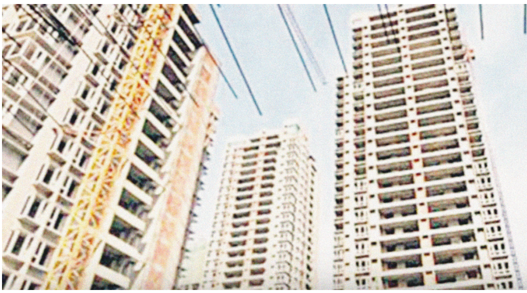
సెక్టార్ బోలెడు అవకాశాలను అందిస్తోందిని చెప్పారు. ఎస్టేట్ సెక్టార్లో రెవెన్యూ, వినియోగం పెరుగుతాయని రానున్న పదేళ్లలో ఎకానమీ మరింత పెరుగుతుందని, రియల్ అంచనా వేశారు.