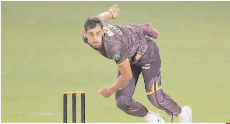
సాధించారు. 2013లో సీఎస్కే తరఫున బ్రావో.. 2021లో ఆర్సీబీ తరఫున హర్షల్ పటేల్ 32 వికెట్లు తీశారు. 2020లో ఢిల్లీ క్యాపిటల్స్కు ఆడిన సౌతాఫ్రికా స్టార్ కగిసో రబద 30 వికెట్లతో రెండోస్థానాన్ని ఆక్రమించాడు. ఇదిలా ఉంటే కేకేఆర్ తాజా సీజన్లో సన్రైజర్స్ హైదరాబాద్తో మార్చి 23న తమ తొలి మ్యాచ్ ఆడనుంది.

ఐపీఎల్-2024 సందడి మొదలైపోయింది. పొట్టి ఫార్మాట్లోని మజాను అందించేందుకు ఆటగాళ్లు.. ఆస్వాదించేందుకు అభిమానులూ సిద్ధమైపోయారు. చెపాక్ వేదికగా చెన్నై సూపర్ కింగ్స్- రాయల్ చాలెంజర్స్ బెంగళూరు మధ్య మ్యాచ్లో శుక్రవారం (మార్చి 22) ఈవెంట్కు తెరలేపనుంది. ఈ నేపథ్యంలో ఆస్ట్రేలియా స్టార్ క్రికెటర్, ఐపీఎల్ కామెంటేటర్ స్టీవ్ స్మిత్ ఆసక్తికర వ్యాఖ్యలు చేశాడు. సహచర ఆటగాడు మిచెల్ స్టార్క్ ఐపీఎల్-2024లో కచ్చితంగా సత్తా చాటుతాడంటూ.. తాజా ఎడిషన్లో ఎన్ని వికెట్లు తీయగలడో అంచనా వేశాడు. కాగా వన్డే వరల్డ్ కప్-2023లో అదరగొట్టిన మిచెల్ స్టార్క్ దాదాపు ఎనిమిదేళ్ల విరామం తర్వాత క్యాష్ రిచ్ లీగ్లో పునరాగమనం చేయనున్నాడు. వేలంలో భాగంగా కోట్లకా నైట్ రైడర్స్ అతడి కోసం పోటీ పడి ఏకంగా రూ. 24.75 కోట్లు ఖర్చు చేసింది. ఫలితంగా ఐపీఎల్ చరిత్రలోనే అత్యధిక ధరకు అమ్ముడుపోయిన ఆటగాడిగా ఈ పేస్ బౌలర్ నిలిచాడు. దీంతో మిచెల్ స్టార్క్పై అంచనాలు కూడా అదే స్థాయిలో పెరిగిపోయాయి. ఈ నేపథ్యంలో ఈఎస్ఎఫ్ఎన్కేక్ఐసీలో మాట్లాడిన ఆసీస్ మాజీ సారథి స్టీవ్ స్మిత్కు స్టార్క్ గురించి ప్రశ్న ఎదురైంది. ఇందుకు బదులిస్తూ.. “నాకు తెలిసి అతడు కొత్త బంతితో కచ్చితంగా మ్యాజిక్ చేయగలడు. ముఖ్యంగా డెత్ ఓవర్లలో అతడి బౌలింగ్ చేస్తూ కాబట్టి వికెట్లు తీసే అవకాశం ఉంటుంది. ఈసారి స్టార్క్ 30 వికెట్లు తీస్తాడని అనుకుంటున్నా” అని స్మిత్ అంచనా వేశాడు. కాగా ఐపీఎల్లో ఒక ఎడిషన్లో అత్యధిక వికెట్లు తీసిన బౌలర్గా డ్యేన్ బ్రావో, హర్షల్ పటేల్ సంయుక్త రికార్డు